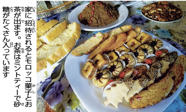
家に招待されるとモロッコ菓子とお茶が出ます。お茶はミントティーで砂糖がたくさん入っています