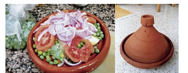
タジンという土鍋を使った料理の作り方を一から教わりました。ラッパのような形のふたをして火にかけます

モロッコでは外国人の私でも分け隔てなく受け入れてくれます。モロッコのマルハバ精神になり、誰でも温かい気持ちで心を開いていきたいです。