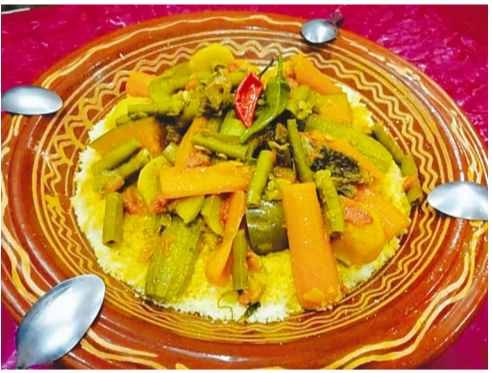
モロッコの伝統料理クスクス。野菜の下にご飯のように見えるのがクスクスです

モロッコ料理が好きです。特に好きなのは、鶏肉と野菜のクスクス(小さな粒々のパスタ)料理です。毎週金曜日のお昼は家族みんなでクスクスを食べます。