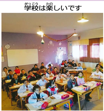
学校は楽しいです